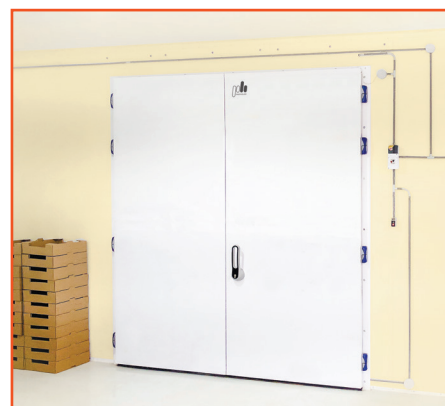
Рисунок 1. Распашная двустворчатая дверь

✓ Неподвижная створка двери закрывается специальной ручкой немецкого производителя STUV. При повороте рычага дверь фиксируется одновременно двумя металлическими стержнями вверх и вниз, что делает закрывание простым и удобным